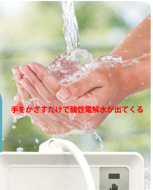
手をかざすだけで酸性電解水が出てくる